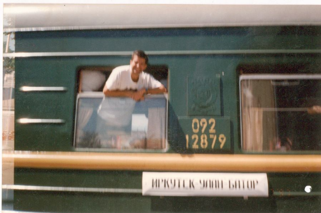
RUSIA: El Trans-siberiano a punto de partir