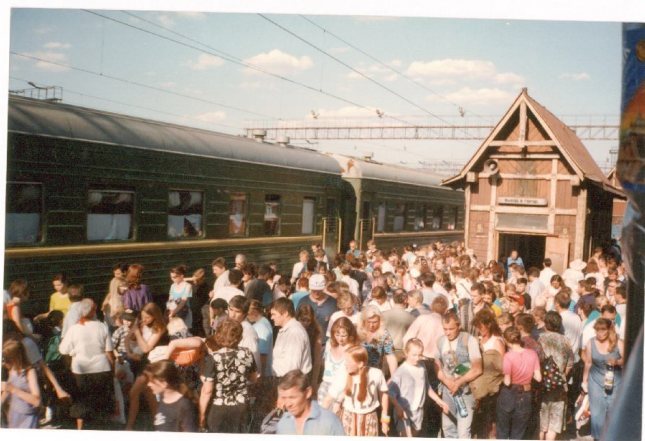
RUSIA: Parada del Trans-siberiano en Krasnoyarsk